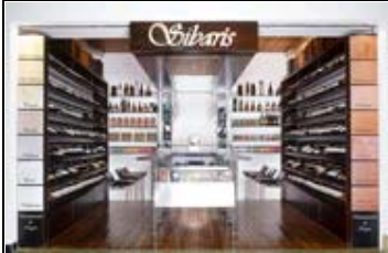
Sibaris Bar, Puente Aéreo Bogotá D.C Arq. Manuel Alejandro Rogelis Terán