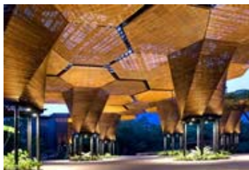
Orquídeo rama Medellín, Antioquia Arq. Felipe Mesa Rico Arq. Alejandro Bernal