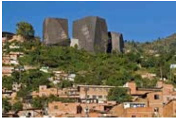
Biblioteca pública España Medellín, Antioquia Arq. Giancarlo Mazzanti