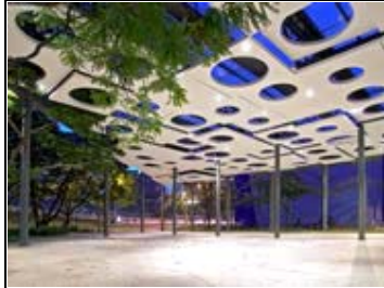
Parque de la Literatura Medellín, Antioquia Arq. Alejandro Restrepo Montoya Arq. Carlos Mario Rodríguez