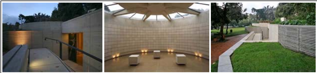
Cenizarios del Gimnasio Moderno Bogotá D.C. Arq. Christian Binkele