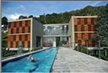
Casa Manantiales Medellín, Antioquia Arq. Carlos Hernández Correa Arq. Edgar Mazo Zapata