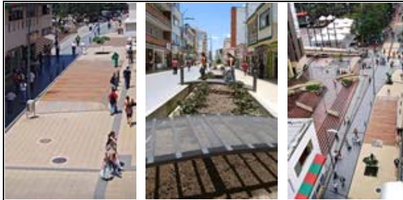
Proyecto Peatonalización Carrera 14 Armenia, Quindío Arq. Jorge Mario Restrepo Restrepo