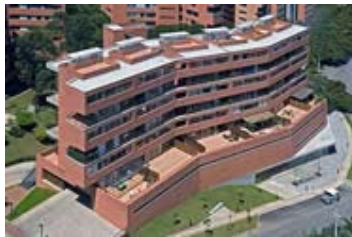
Edificio Guayacán de Avión Medellín, Antioquia Arq. Carlos Pardo Botero Arq. Mauricio Zuluaga Latorre Arq. Nicolás Vélez