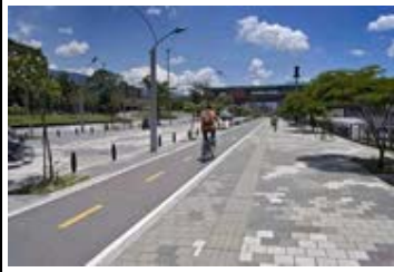
Paseo urbano Carabobo Medellín, Antioquia Arq. Alejandro Echeverri Restrepo Arq. Carlos Mario Rodríguez