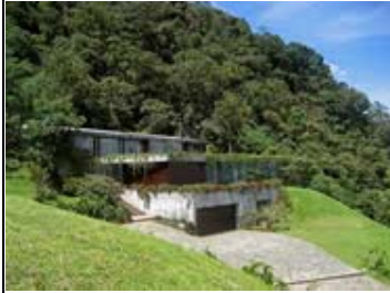
Casa Bosque Cedro Verde Medellín, Antioquia Arq. Alejandro Echeverri Restrepo Arq. Juan Bernardo Echeverri