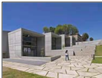
Biblioteca San Javier Medellín, Antioquia Arq. Javier Vera