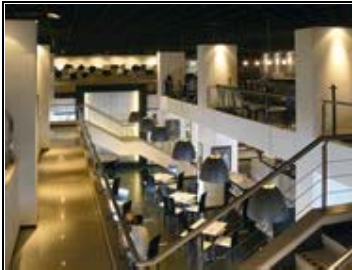
Café de las Letras Bogotá D.C Arq. Juan Carlos Rojas Irragori